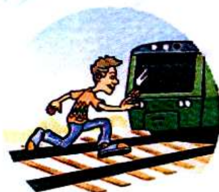
Перебегать пути перед поездом.

Слушать плеер и говорить по телефону, т. к. можно не услышать сигналы приближающегося поезда и объявления диктора.