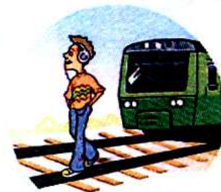
Слушать плеер и говорить по телефону вблизи железной дороги.