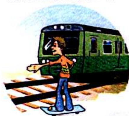
Кататься вблизи железной дороги.